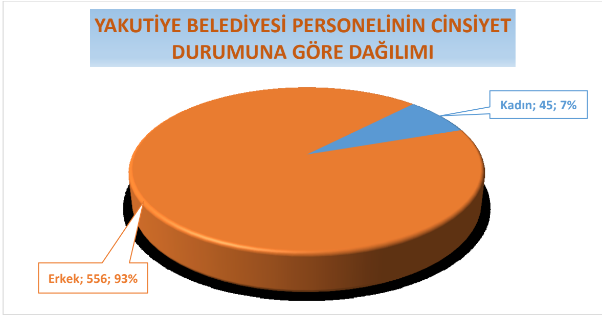
Şekil 2: Yakutiye Belediyesi Personelinin Cinsiyet Durumuna Göre Dağılımı