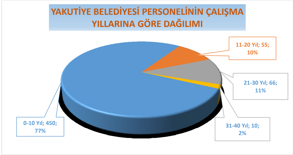
Şekil 4: Yakutiye Belediyesi Personelinin Çalışma Yıllarına Göre Dağılımı

Yukarıdaki grafiğe bakıldığında Yakutiye Belediyesi personelinin (Memur, Sürekli İşçi, Sözleşmeli Personel, Taşeron İşçi, Meclis Üyesi Başkan Yardımcıları) % 77'si 0-10 Yıl, %10'u 11-20 yıl, %11'i 21-30 yıl ve %2'si 31-40 yıllık bir süreçte belediyeye hizmet vermiş ve vermeye devam etmektedirler.