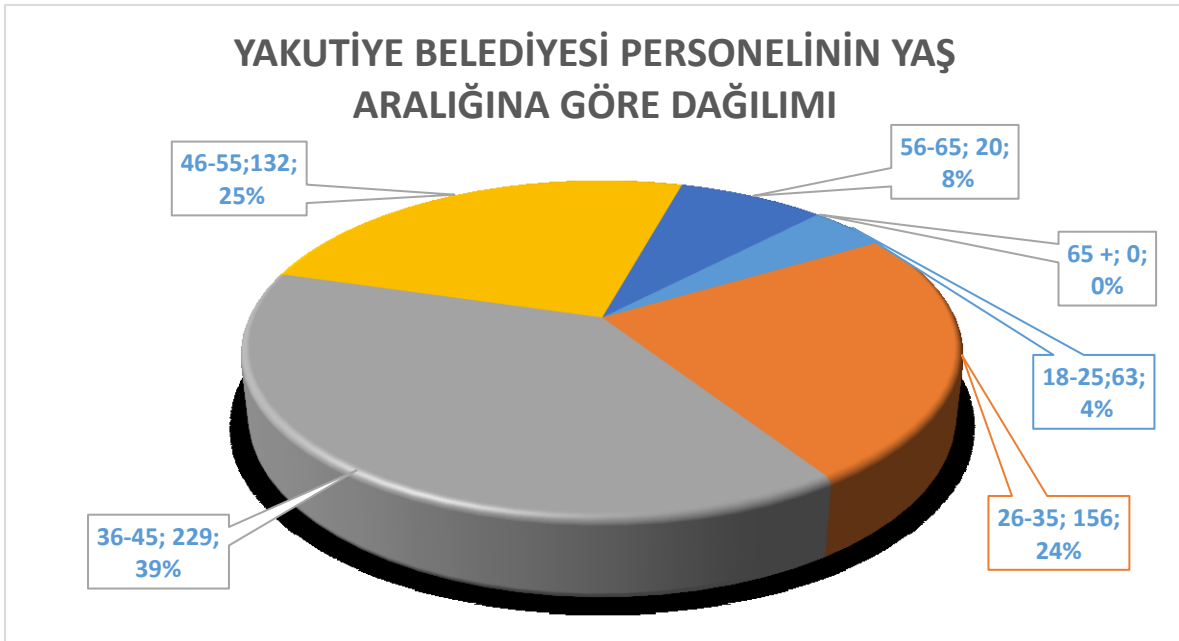
Şekil 3: Yakutiye Belediyesi Personelinin Yaş Aralığına Göre Dağılımı

Yukarıdaki grafikte, Yakutiye Belediyesi personelinin (Memur, Sürekli İşçi, Sözleşmeli Personel, Taşeron İşçi, Meclis Üyesi Başkan Yardımcıları) yaş aralığı gösterilmiştir. Buna göre belediyenin %4'lük kısmını 18-25 yaş aralığında personel oluştururken %24'lük kısmını 26-35, %39'luk kısmını 36-45, %25'lik kısmını 46-55, %8'lik kısmını 56-65 yaş aralığı oluşturmaktadır. Belediyemizde 65 üstü yaş aralığındaki personel bulunmamaktadır.