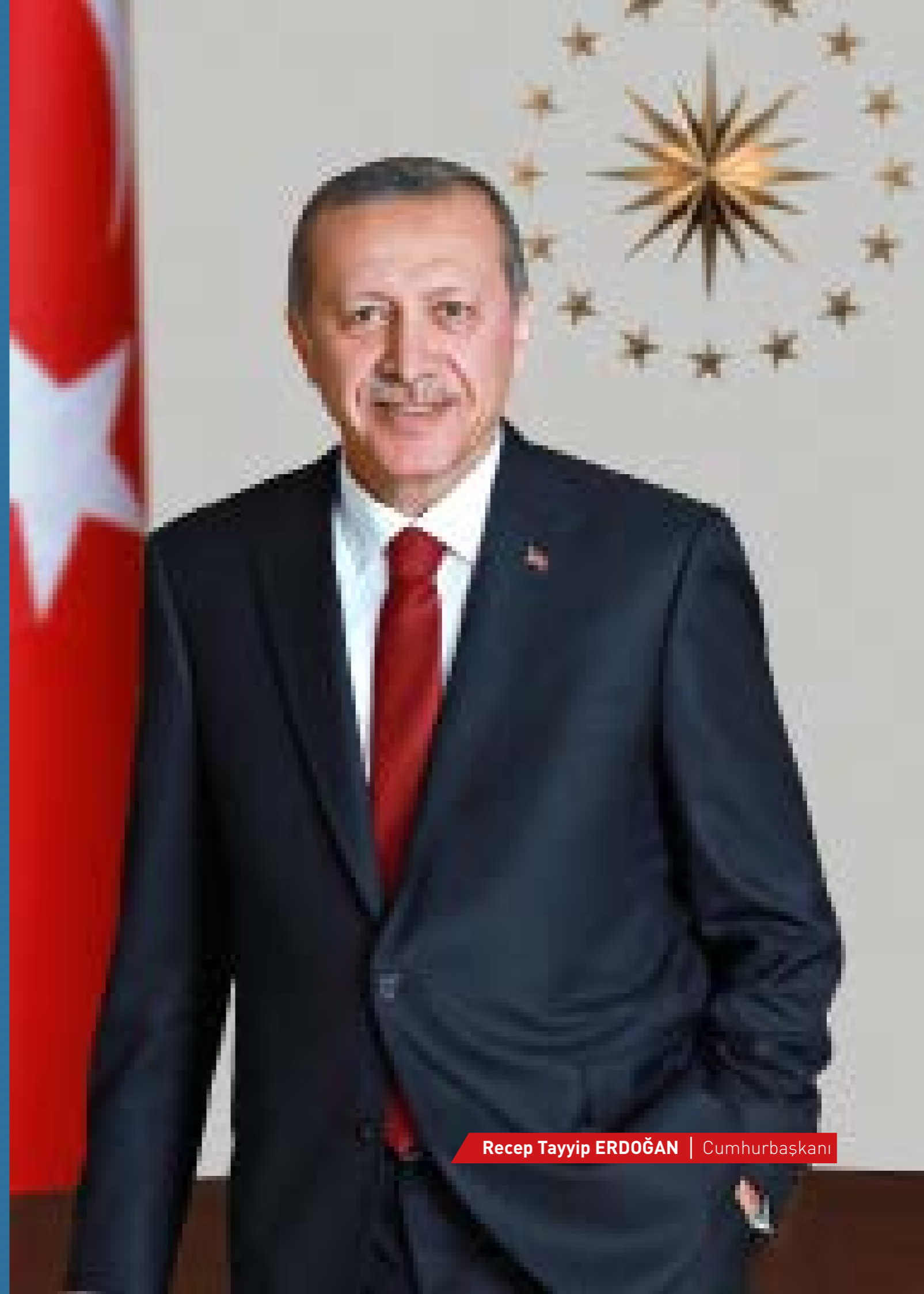
Recep Tayyip ERDOĞAN | Cumhurbaşkanı