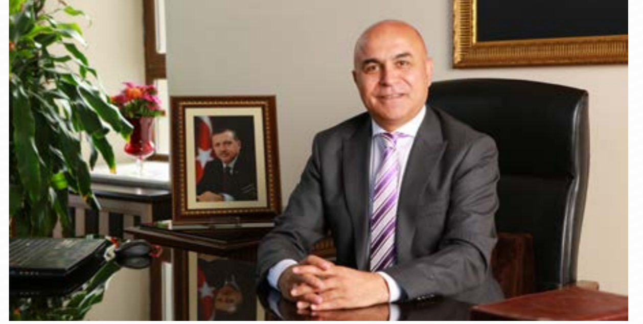
Ali KORKUT Belediye Başkanı