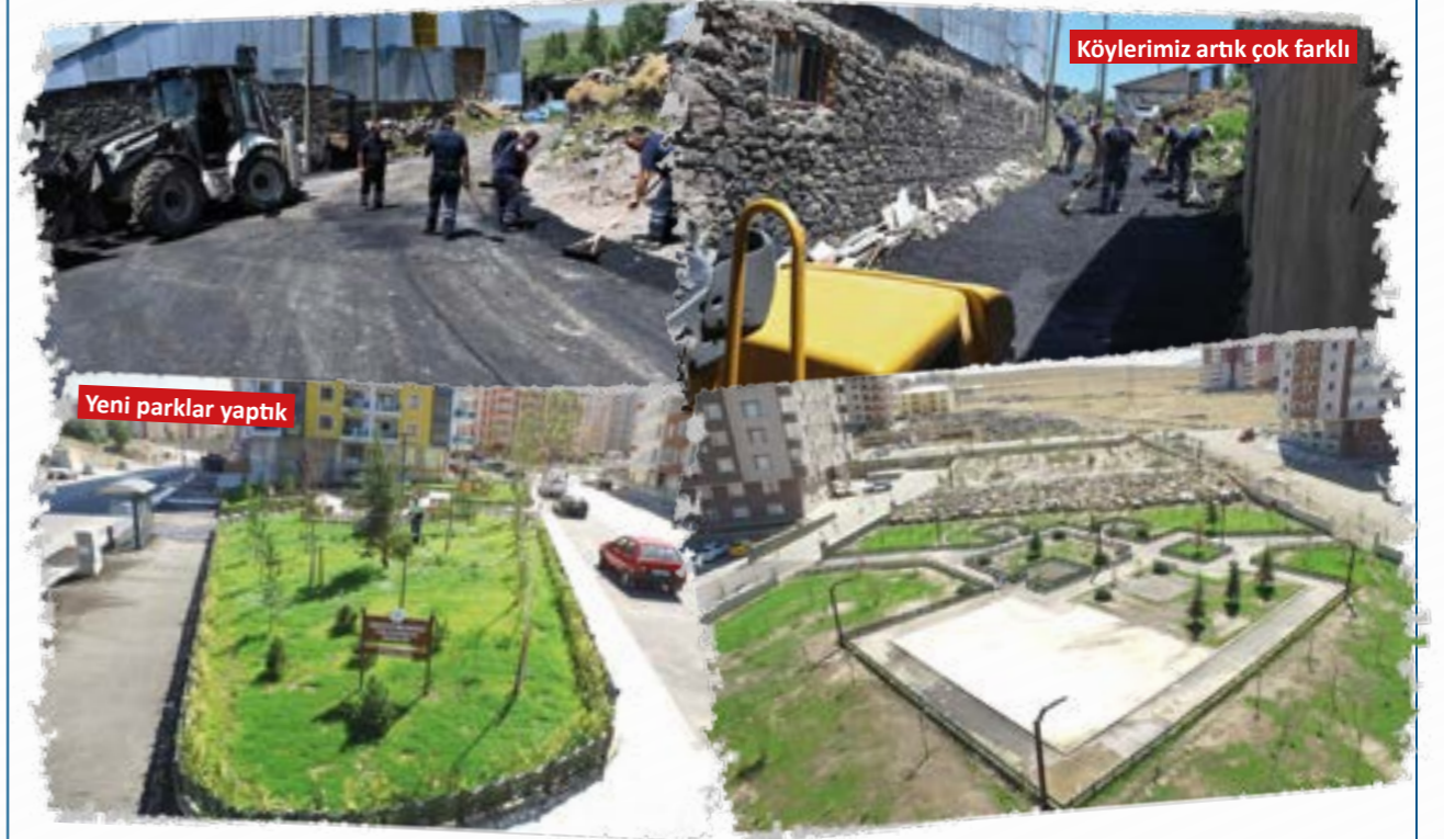
Köylerimiz artık çok farklı