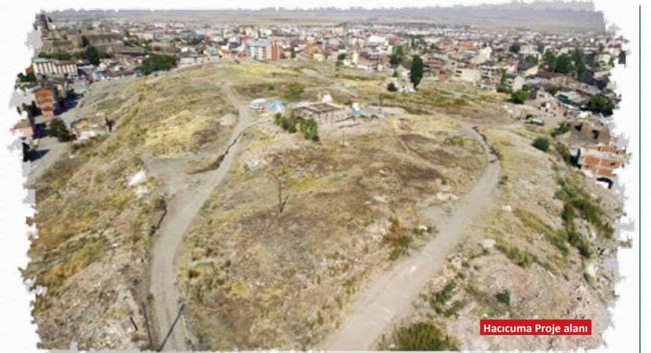
Hacicuma Proje alanı

milyonu personel harcamalarına gitmekteydi. 2010 yılı bütçemiz 35.4 milyon, personel giderimiz ise 25.9 milyon lirayı bulmaktaydı. Değişim için değişime inanmak, Türkiye'nin değişiminde öncü bir Liderini (Recep Tayyip Erdoğan)'ı örnek alıp aynı yolda yürümek gerekiyordu.