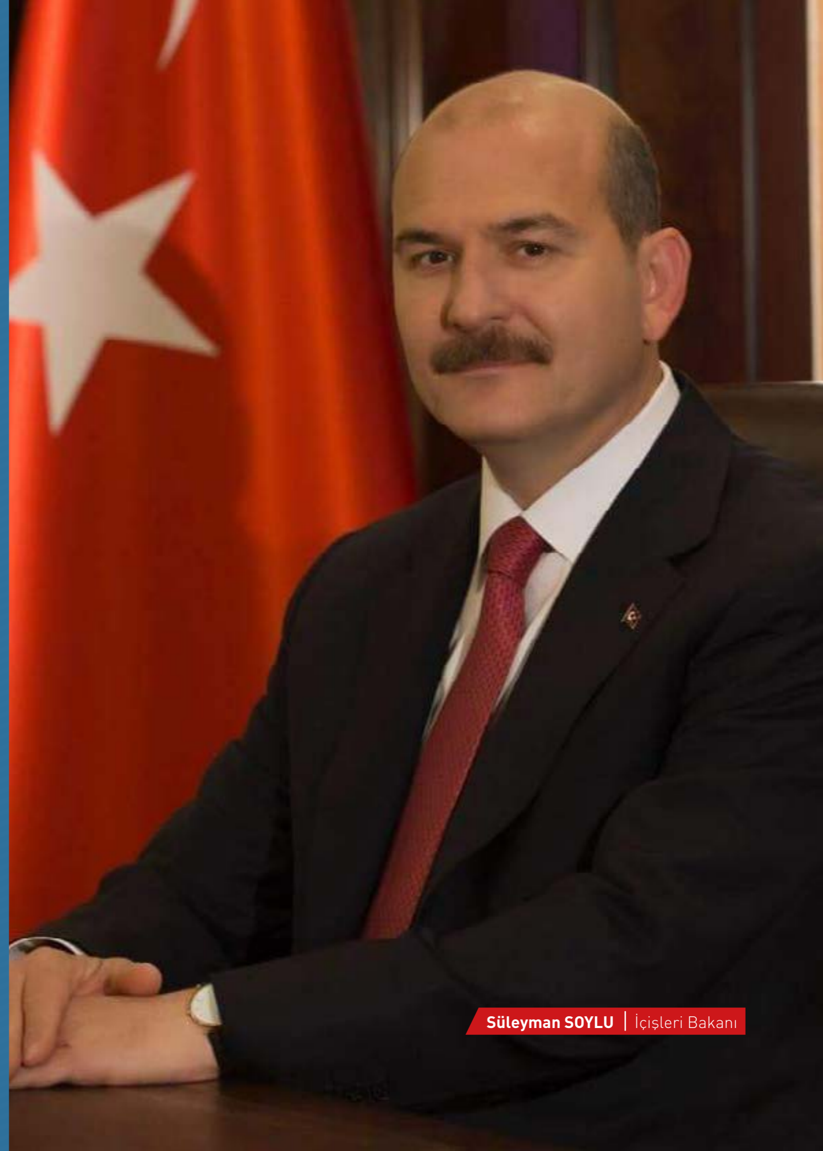
Süleyman SOYLU | İçişleri Bakanı