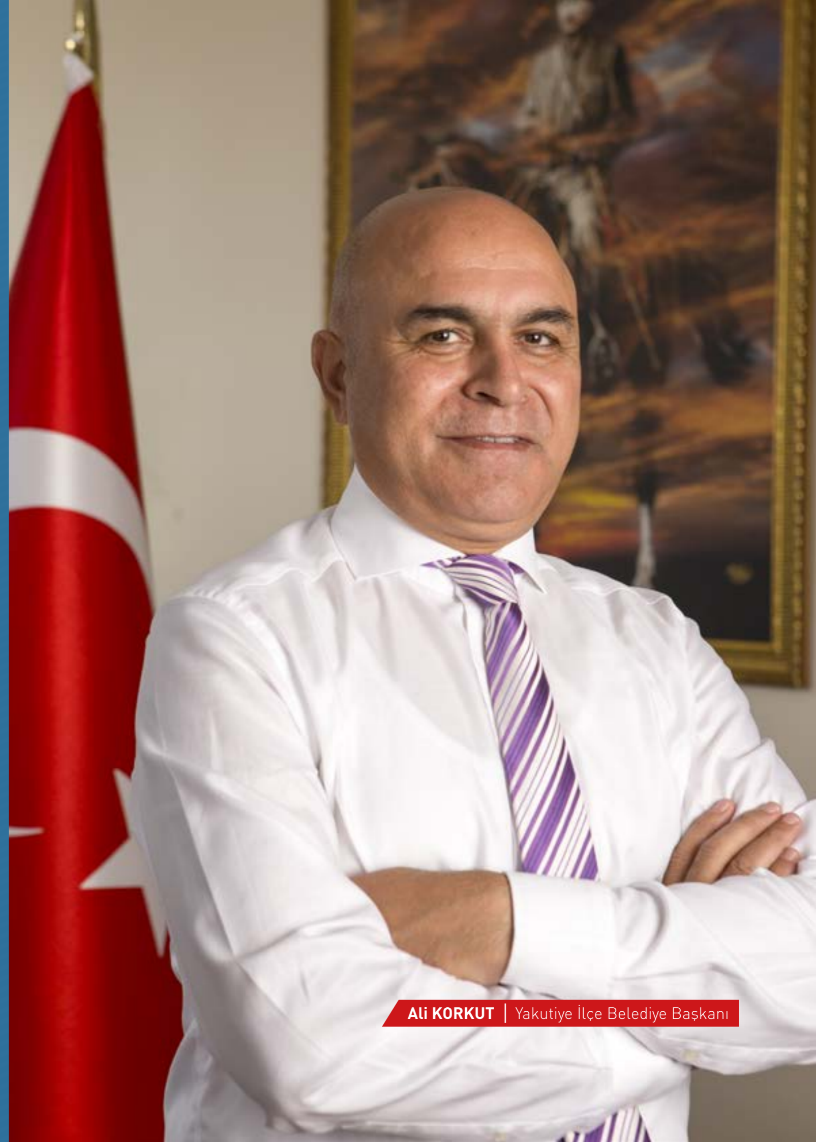
Ali KORKUT | Yakutiye İlçe Belediye Başkanı