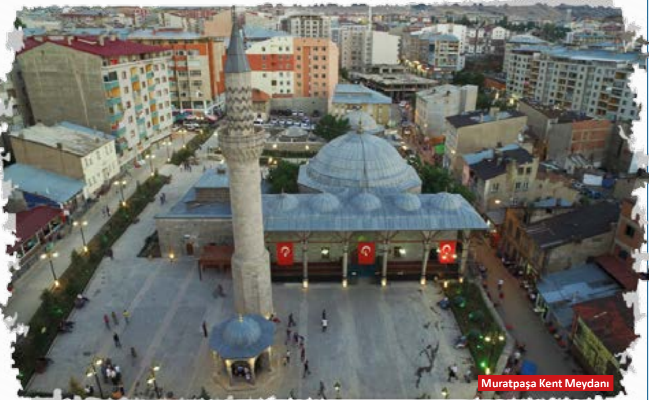
Muratpaşa Kent Meydanı

Bu amaçla bizzat evlerine giderek, kapılarını çalarak yoksulluk sınırında yaşayan insanlarımızı ziyaret ediyorum. Evlerinin zorunlu ihtiyaçlarını karşılayarak onlara destek oluyoruz. Her yıl