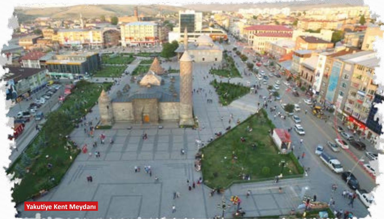
Yakutiye Kent Meydanı

Yakutiye İlçe Belediyesi, mevcut sorunlu yapısıyla belediye olmaktan çok uzaktaydı. Bunun için yeni bir başlangıca ihtiyaç vardı. 2009 yılı bütçemiz 37 milyon civarındaydı. Bütçenin 28.2